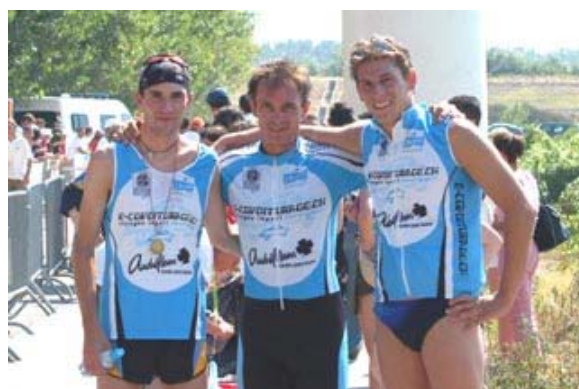
Petite photo souvenir