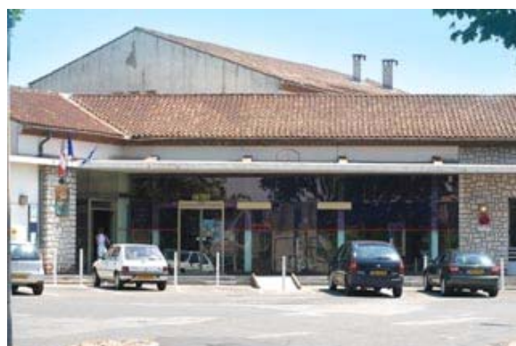
La petite gare d'Orange