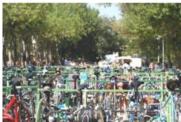
La zone de transition