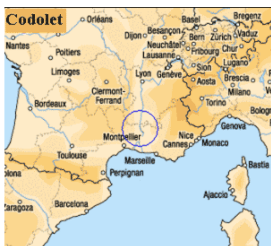
Codolet se trouve à une centaine de kilomètres au nord de Montpellier (cf cercle bleu)