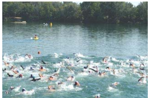
Le coup d'envoi vient d'être donné