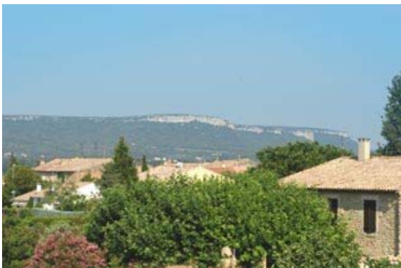
Il est 8 heures le matin ; vue sur le village de Codolet et les alentours