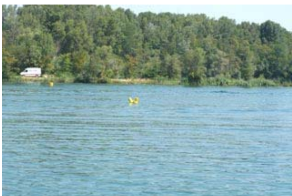
Prise de vue du lac à nouveau tranquille