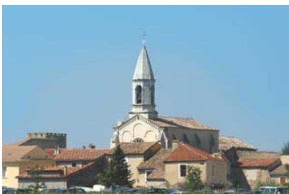
La jolie église de Saint-Michel